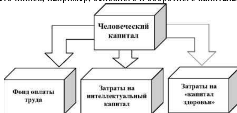
Рисунок 1. Структура затрат на человеческий капитал

Для того, чтобы оценить влияние человеческого капитала организации на его финансовые результаты, необходимо, чтобы он имел количественное выражение. Так как в основном расчёт финансовых показателей основывается на затратах, то оптимально будет взять за основу количественной оценки человеческого капитала затратный подход. Преимущество затратного подхода к оценке человеческого капитала состоит в том, что он позволяет получить величину человеческого капитала в стоимостной оценке, интегрируемой с оценками других источников, например, основного и оборотного капитала.